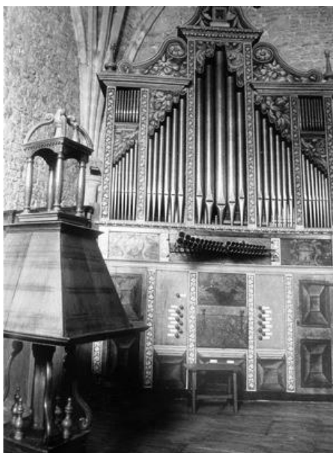
Fig. 1 – Fray Joseph de Eizaga Echevarría: fachada del órgano de la colegial de Zenarruza (1686).

Chirimía (m.i.) contrapuestos a Trompeta magna , Clarín y Oboe/Clarín (m.d.). Este paso de la máxima relevancia dará lugar a la sistematización del concepto, que se impondrá en todos los instrumentos de prestigio de la península, quedando prácticamente inalterado en su principio fundamental – aunque tendiendo a la monumentalidad –, hasta los años 1880 21 .