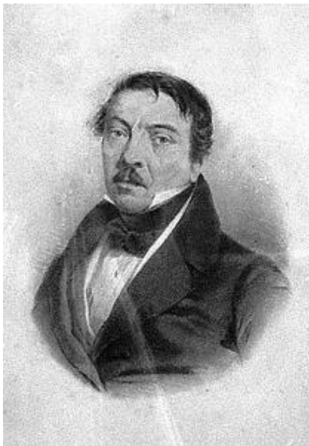
Fig. 10 – Ramón Carnicer i Batlle, pintura de autor desconocido, Museo Comarcal d’Urgell.

La Sonata V , igualmente bipartida, es llamada “de clarins, cadireta y ecos”, valiéndose por tanto de la creación de tres planos sonoros bien contrastados. La obra presenta, a ejemplo de la Sonata III , una alternancia entre pasajes muy enérgicos escritos para Clarines 136 (compases 1-4, 8-17, 26-32, 41-57 – estos últimos alternados con ecos, con toda la probabilidad, remedos de los mismos Clarines 137 – 82-88, 89-92, 97-115 – aquí seguramente acompañados por la cadereta – 127-130, 134-137, 148-152, 164-175) y otros más líricos reservados a la cadereta 138 , cuya melodía es siempre de exclusividad de la mano derecha – aunque igualmente aquí se trate de una textura para tañer seguido.