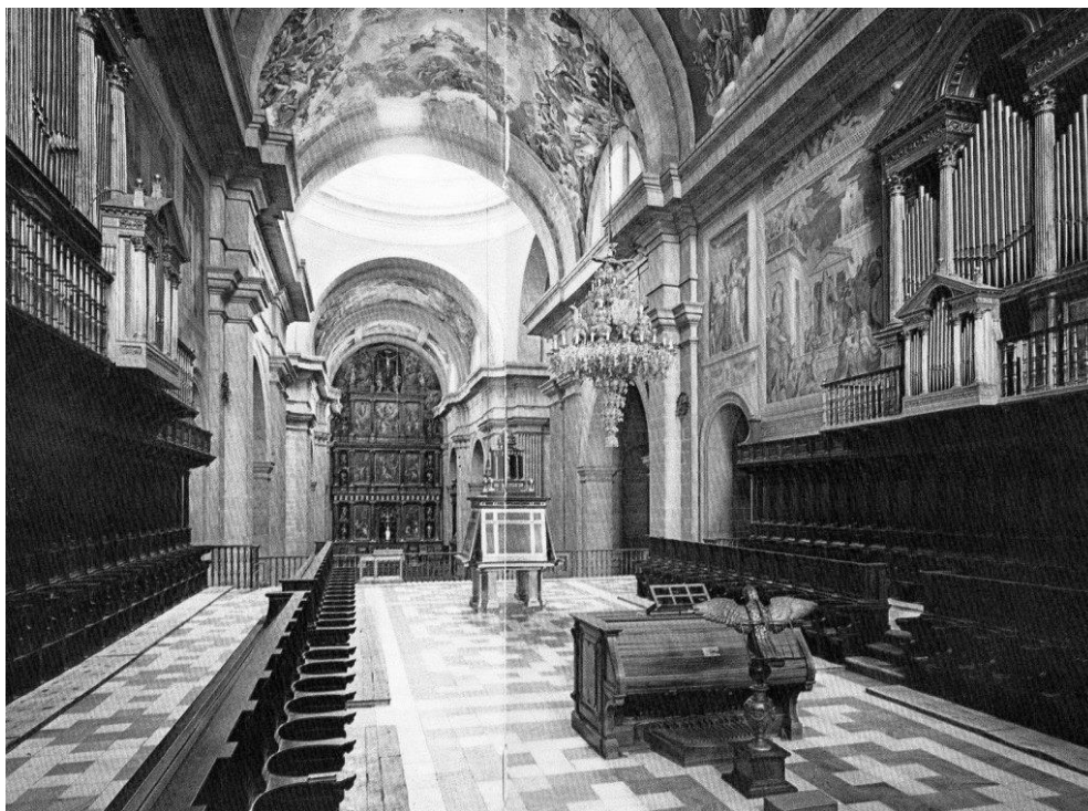
Fig. 8 – Órganos del coro del Real Monasterio de San Lorenzo de El Escorial: à la izquierda, el órgano del Vicario, in cornu Evangelii ; à la derecha, el órgano del Prior, in cornu Epistolae .

corroborado por el ámbito igualmente excepcional de los mismos, alcanzando el f'' – Verso 7 114 .