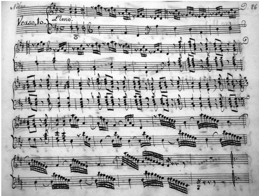
Fig. 9 –Libro de órgano Melchor López (1781), Verso n. 10 de José de Nebra, Archivo de la Catedral de Santiago de Compostela.

Otro conjunto de obras digno de interés en lo que atañe a la registración son las Sis sonates per orgue o fortepiano 132 compuestas por Ramón Carnicer 133 durante su