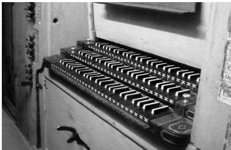
Fig. 4 – Consola del órgano De la Orden (1781-1782) de la Catedral de Málaga.

muy largo el referirlas, y que deben quedar á la habilidad, inteligencia, y practica de los Organistas 74 .